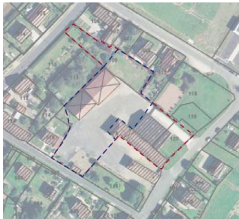
En rouge : secteur de l'OAP En bleu : périmètre dévolu à l'habitat